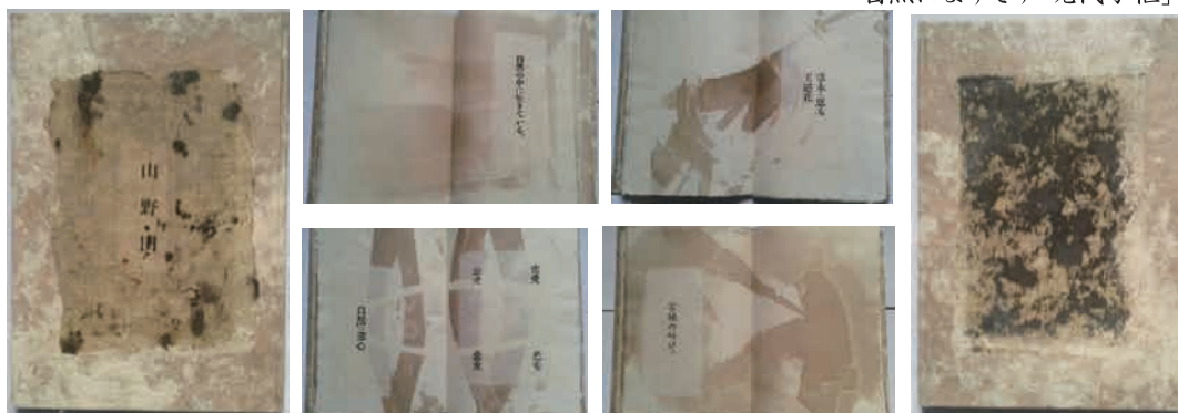
自然によりそう「現代写植」